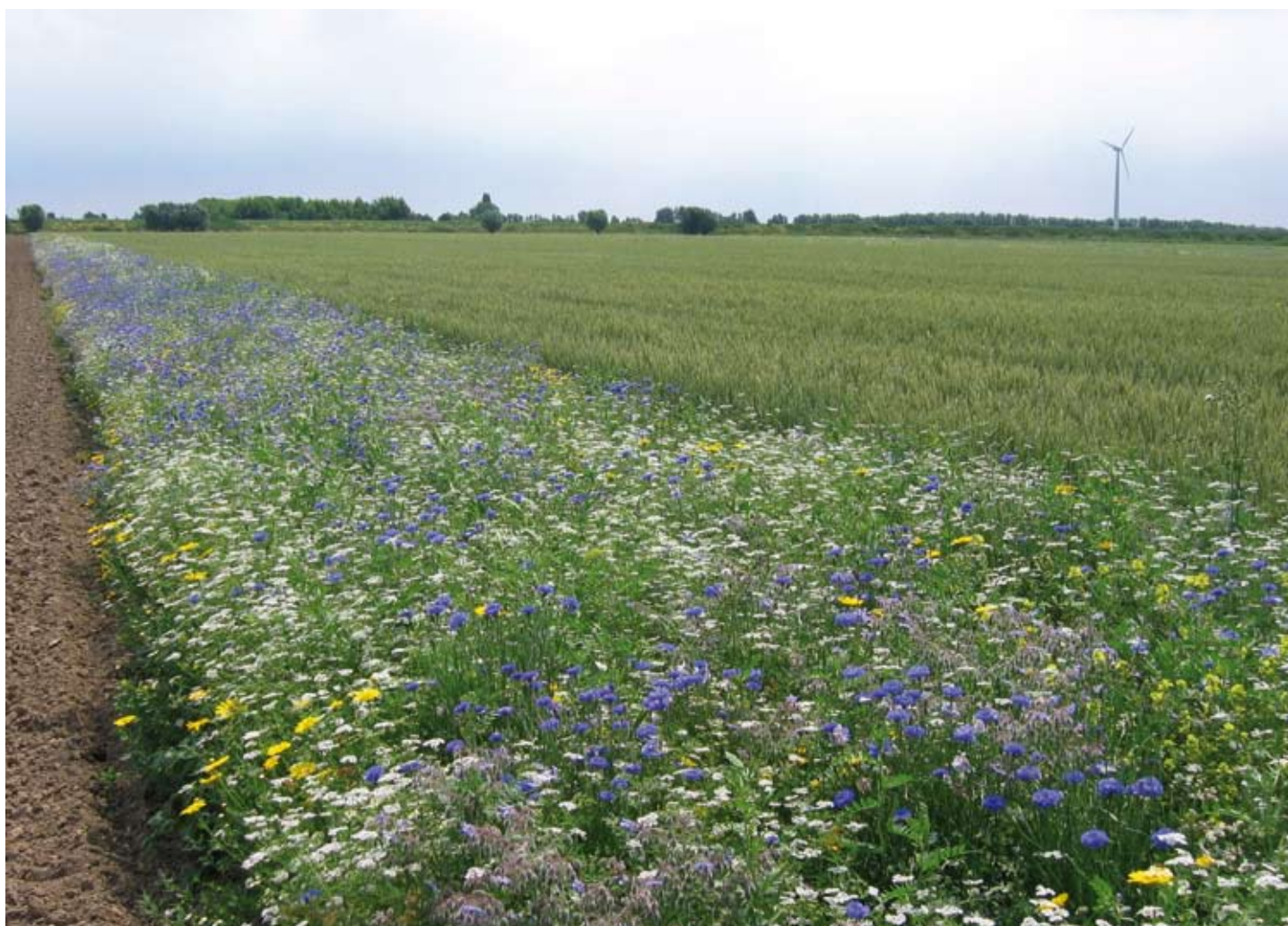
2. Voor natuurlijke vijanden ontworpen eenjarige akkerrand langs zomertarweperceel in de Hoeksche Waard, met korenbloem, boekweit, koriander, ganzebloem, venkel en voederwikke. Annual flower strip in margin of spring wheat field in the Hoeksche Waard, Zuid-Holland, designed to feed natural enemies, with cornflower, buckwheat, coriander, corn marigold, fennel, borage and common vetch.

Om een plaag effectief te bestrijden moeten natuurlijke vijanden in voldoende aantallen in het gewas aanwezig zijn ruim voordat de economische schadedrempel wordt bereikt. Dit betekent dat zodra er voor de natuurlijke vijanden voldoende prooi in het gewas aanwezig is om met een opbouw te beginnen, er