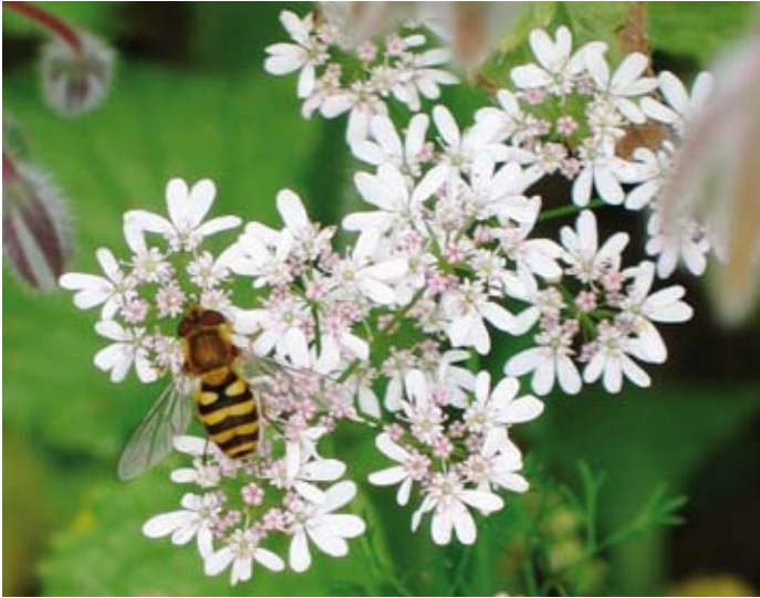
1. Bessenbandzwever Syrphus ribesii (Linnaeus) bezoekt koriander. Syrphus ribesii visits coriander ( Coriandrum sativum ).